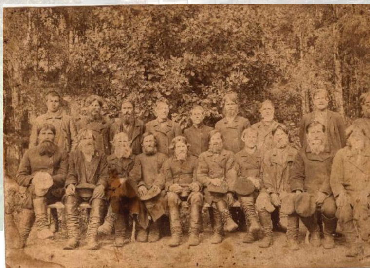
Рис. 2. Крестьяне деревни Каёво Каёвской волости Крестецкого уезда Новгородской губернии

Кроме перечисленных людей в начале XX века поблизости жили многие сотни, тысячи простых граждан, например, эти селяне: