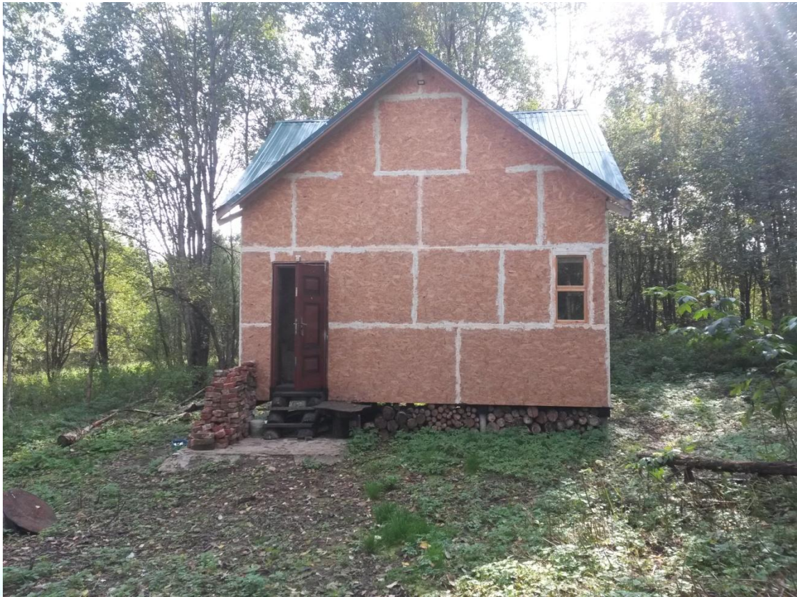
Рис 7. Дом для трудников возле храма

В июне 2021 года совершена установка придорожного Поклонного креста возле автомобильной дороги Окуловка – Любытино в непосредственной близости от храма Святой Троицы в Язвицах.