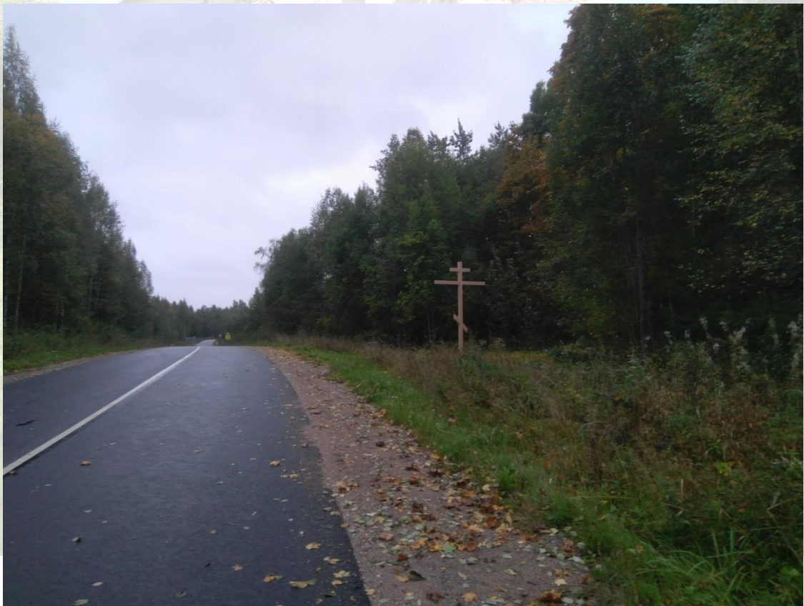
Рис.8. Придорожный Поклонный крест. Вид со стороны Любытина. Сентябрь 2021 года

В июне 2021 года совершена установка придорожного Поклонного креста возле автомобильной дороги Окуловка – Любытино в непосредственной близости от храма Святой Троицы в Язвицах.