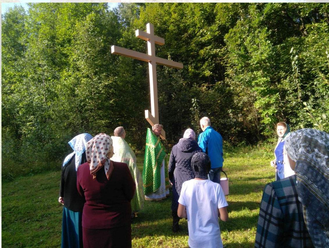
Рис. 10. Освящение придорожного Поклонного креста. Август 2021 года.