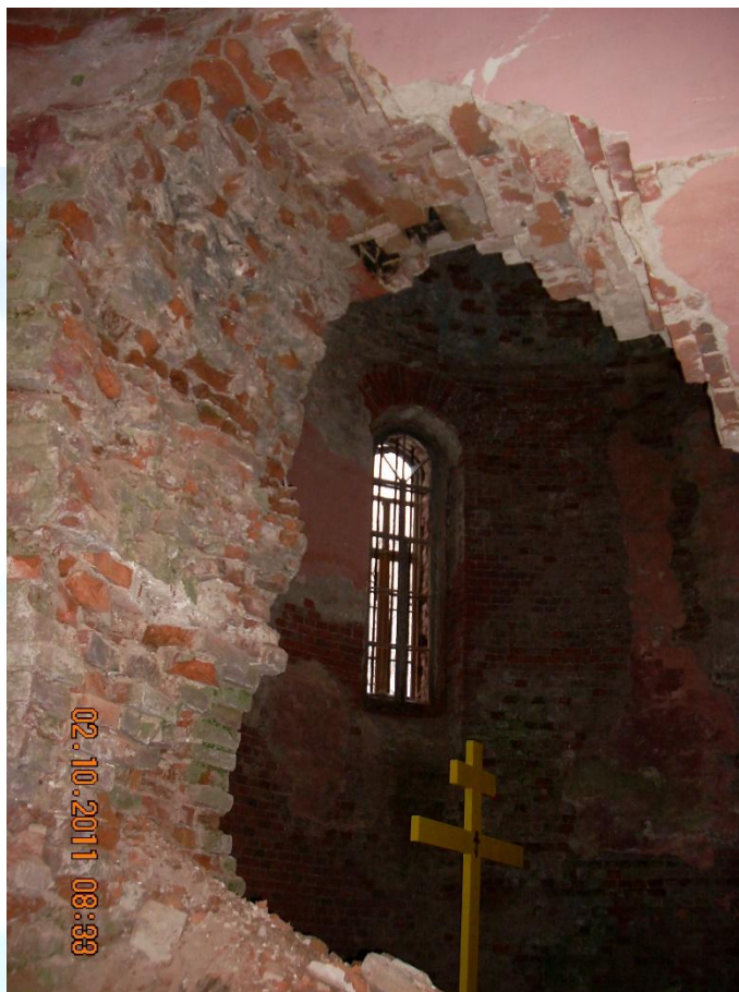
Рис. 6. Повреждения в алтарной части храма

Представители нашей организации считают, что восстановление храма Святой Троицы в Язвицах будет положительно способствовать развитию данного участка местности, что благотворно отразится на всех представителях целевых групп, указанных в нашем проекте.