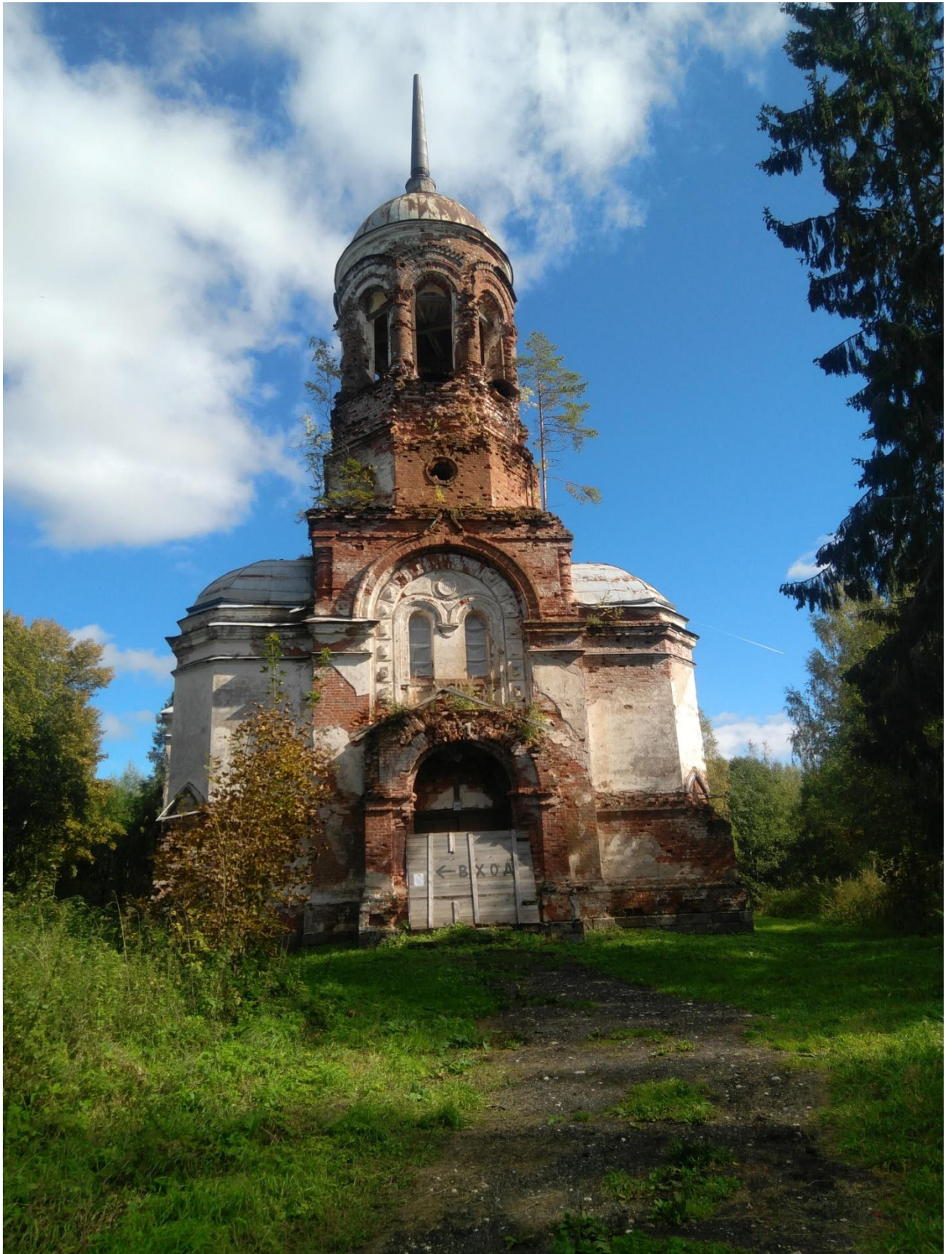
Рис. 5. Фотография от сентября 2021 года