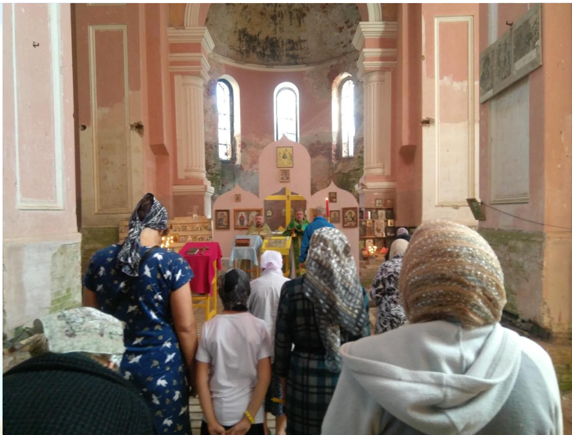
Рис. 9. Божественная Литургия в августе 2021 года.

Начиная с 2017 года в храме Святой Троицы в Язвизях начали проводиться Божественные Литургии, которые посещают около 50 человек. Мы надеемся, что в последующем это число будет расти по мере развития прилегающей к храму территории.